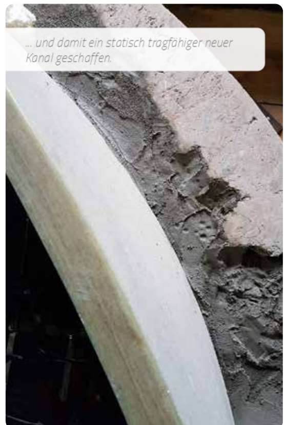
... und damit ein statisch tragfähiger neuer Kanal geschaffen.

Die einzelnen NC-Rohre wurden durch mehrere Baugruben in den alten Kanal abgesenkt, mit einem Spezialwagen zur Montagestelle transportiert und anschließend mit einer hydraulischen Kupplungsvorrichtung verbunden. Schließlich wurde der verbleibende Ringraum zwischen dem alten und dem neuen Kanal mit flüssigem Verguss gefüllt. →