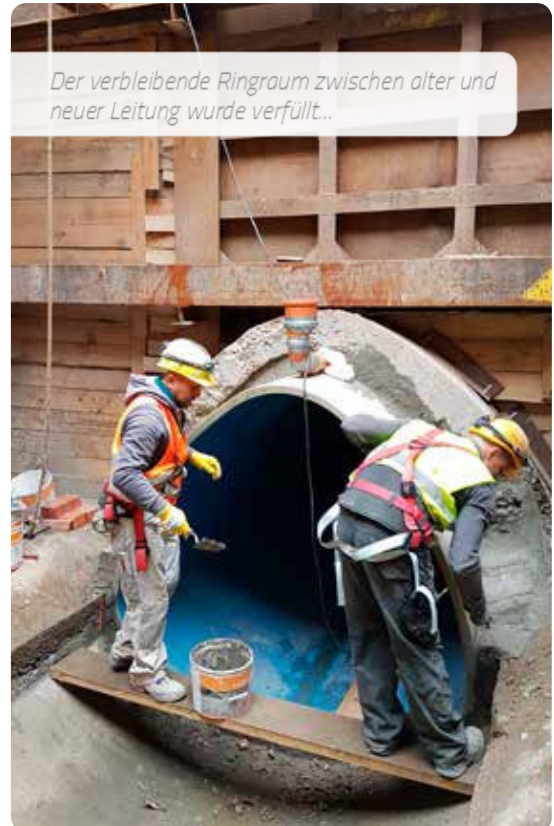
Der verbleibende Ringraum zwischen alter und neuer Leitung wurde verfüllt...

Beim jüngsten Bauabschnitt wurde der Altkanal mittels Laserscanning und manuell mit einer Schablone geprüft und kalibriert, um die Rohrdimensionen zu bestimmen und den Querschnittsverlust auf das notwendige Maß zu minimieren. Amiblu maßfertigte und lieferte die erforderlichen nicht-kreisrunden Profile mit Querschnitten von 1900/1820 mm, 2060/2010 mm und 2240/2180 mm und Längen von bis zu 3 m. Zur Aufrechterhaltung des Netzbetriebs wurde eine Bypassleitung für das Abwasser gebaut.